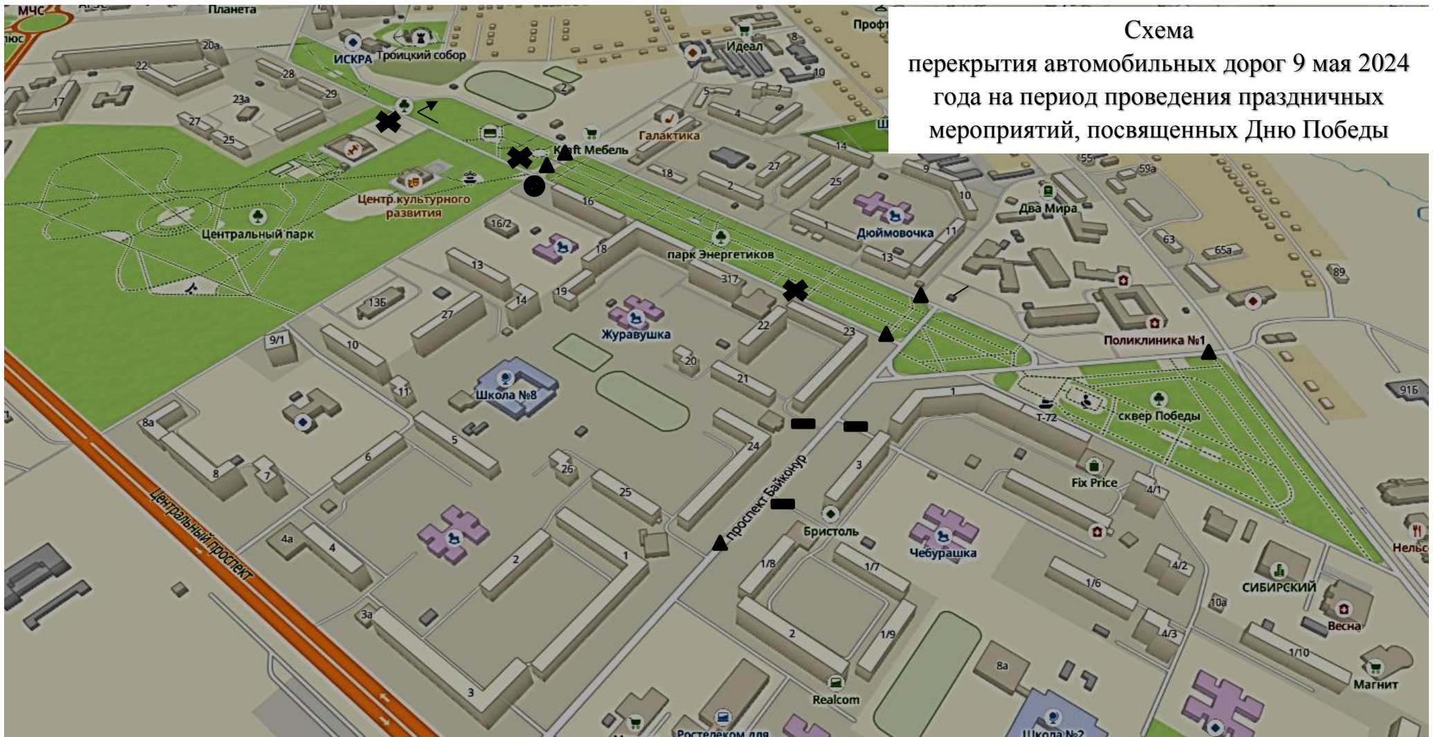
Схема перекрытия автомобильных дорог 9 мая 2024 года на период проведения праздничных мероприятий, посвященных Дню Победы